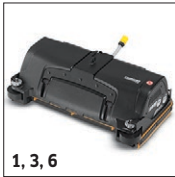
1, 3, 6