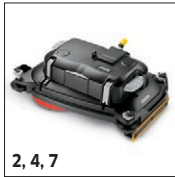
2, 4, 7